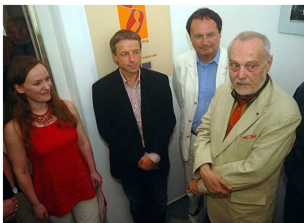
SLAVNOSTNÍ OTEVŘENÍ CENTRA ALMA 27. 4. 2009