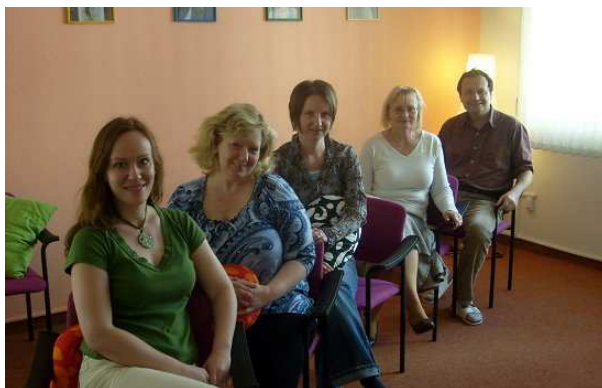
ZAKLÁDAJÍCÍ TÝM CENTRA ALMA