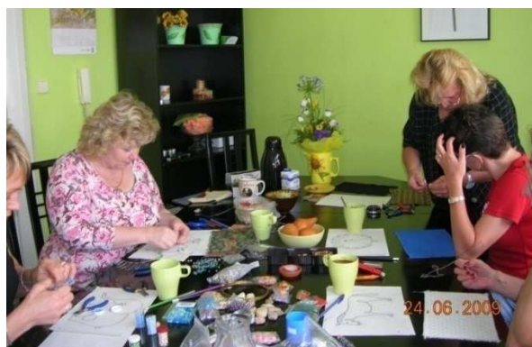
DOLÉČOVACÍ AKTIVITY V CENTRU